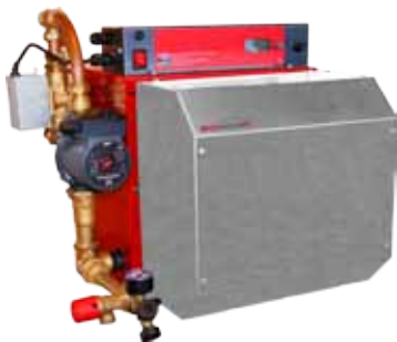
HR-Serie nach der Umrüstung

feuerungsanlagen (1. BImSchV) vom März 2010 wurden Luftqualitätsstandards und Emissionshöchstmengen festgesetzt, die bei den innovativen Blautherm® DUO BE Brennern nicht nur eingehalten, sondern wesentlich unterschritten werden. Die DUO-Blockbauweise des SCHEER-Brenners und das Gleichstromgebläse mit Drehzahlregelung und -überwachung ermöglicht einen geringeren Verbrauch an elektrischer Energie als konventionelle Lösungen.