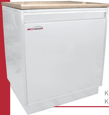
KHZ Klassik KHZ Exklusiv

Kesselkörper, Ausdehnungsgefäß, Sicherheitsventil, automatische Entlüftung, Manometer, komplette Kesselregelung mit witterungsgeführter Regelelektronik.